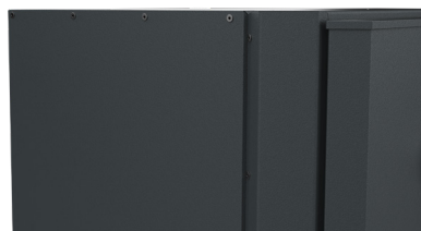
FINITION RIVETÉE SPÉCIALE « ACIER GALVANISÉ ANTI-ROUILLE »